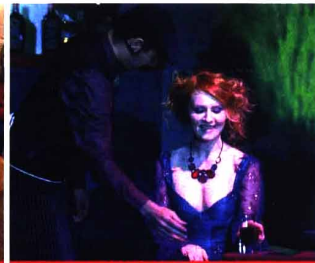
Muzički gost: Aleksandra Kovac